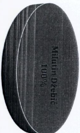
Vlasnička struktura prije i nakon mjera restrukturiranja

Tvrtka MG ADRIA UGOSTITELJSTVO D.O.O. je u 100%-tnom privatnom vlasništvu, a vlasnik je Milutin Džebić. Nakon restrukturiranja vlasnička struktura tvrtke neće se mijenjati. U nastavku se nalazi grafički prikaz vlasničke strukture prije i nakon mjera restrukturiranja.